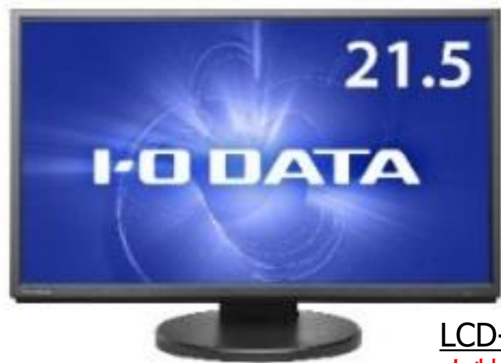
LCD-MF224ED(B・W)オープン価格 大特価 ¥14,500(税別)