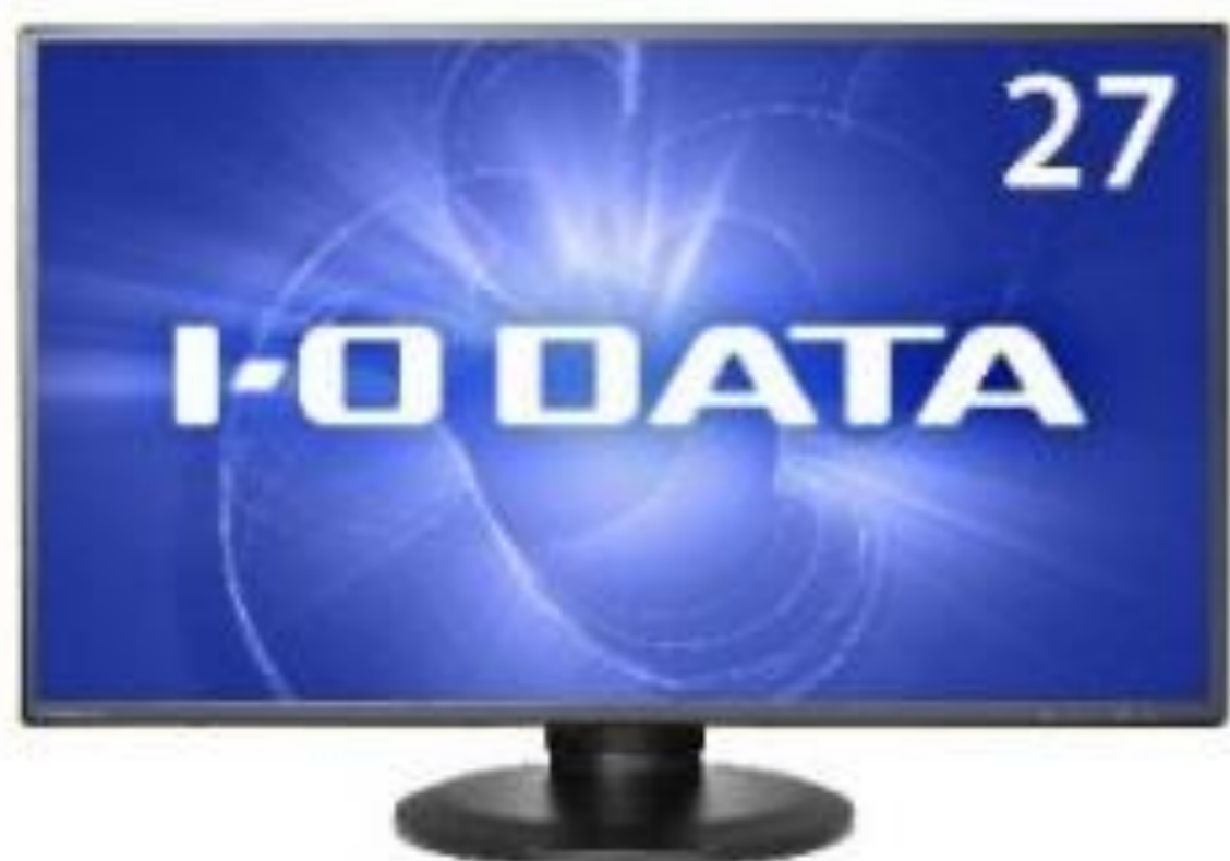
LCD-MF272EDB オープン価格 大特価 ¥19,000(税別)