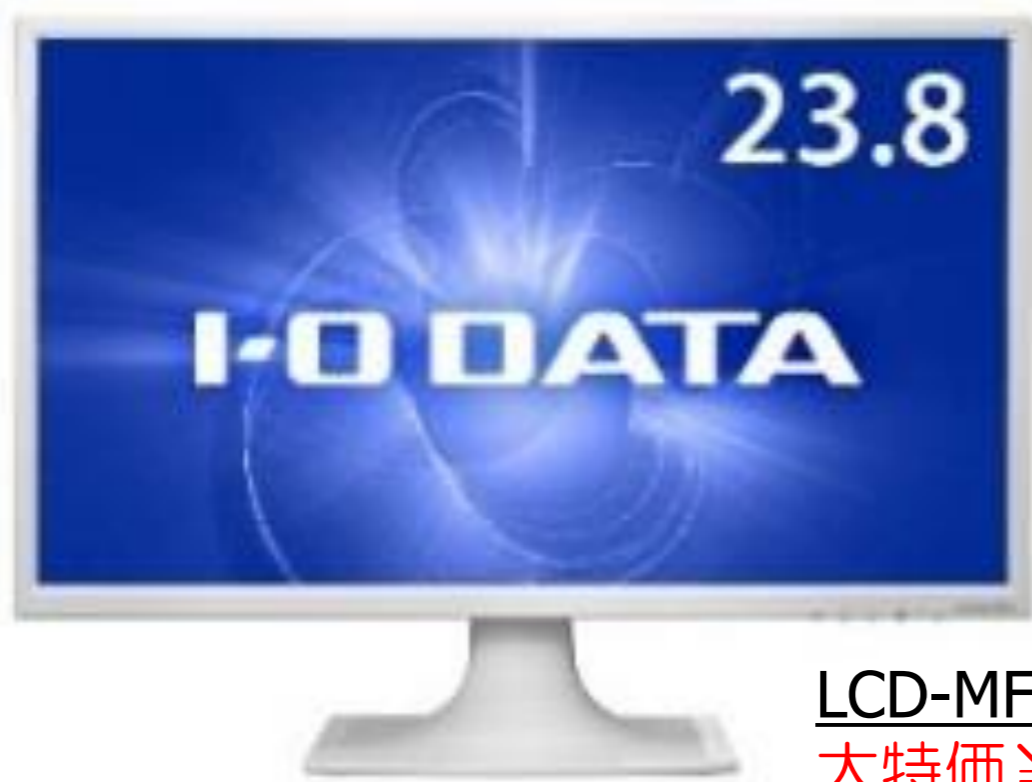
LCD-MF244EDS(W・B)オープン価格 大特価 ¥15,200(税別)